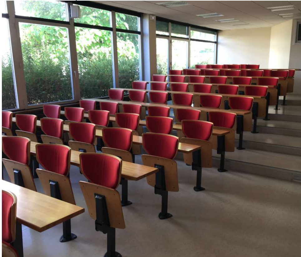
SALLE 64 - 48 places - Fauteuil à bras pivotant - Mécanisme LAMM