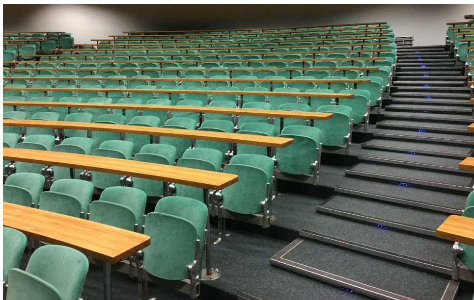
POINCARÉ - 781 places - Fauteuil BR